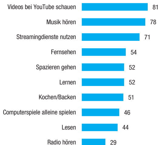
Abbildung 2 Gesteigerte Tätigkeiten während der Schulschließungen "mache ich mehr als vor der Corona-Krise", in %

Basis: alle Befragten, n= 1 002, Schüler im Alter zwischen 13 und 19 Jahren.